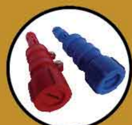
Pengikat Sabit Nylon