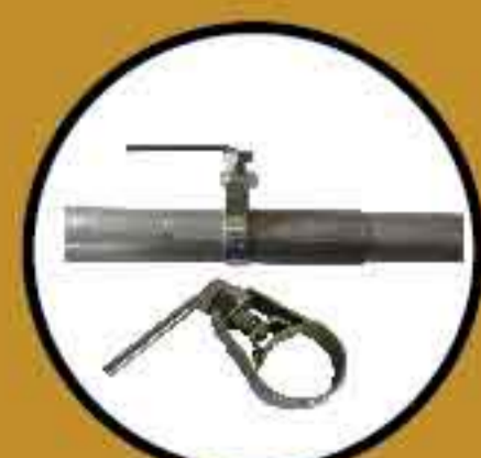
Klem Besi Bulat