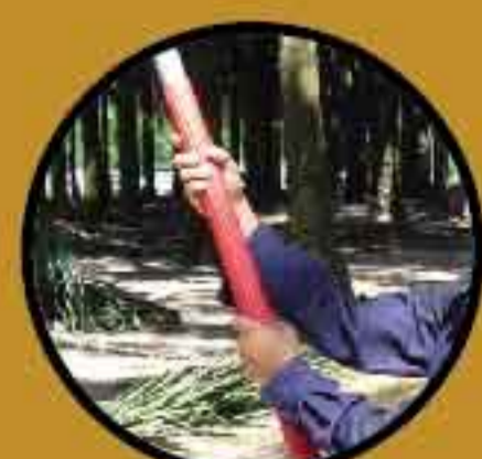
Karet Pelindung Pangkal